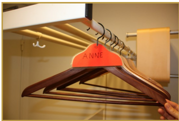
Kleshengere med navnelapper.