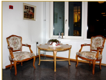
En erindringslund gjør korridoren mer gjenkjennelig og hjemmekoselig.

• Internopplæring om demensvennlige omgivelser.