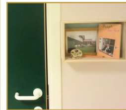
Erindringsbokser ved hver dør.

• Navneskiltene på beboernes dører er blitt større og satt i øynehøyde. For å gjøre beboernes dører enda mer gjenkjennelige, har de laget erindringsbokser ved hver dør. Kontaktperson og pårørende er blitt bedt om å ta med ting som beboeren har et forhold til. Det